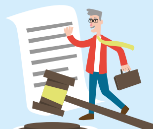
4. Bestuurlijke inbedding