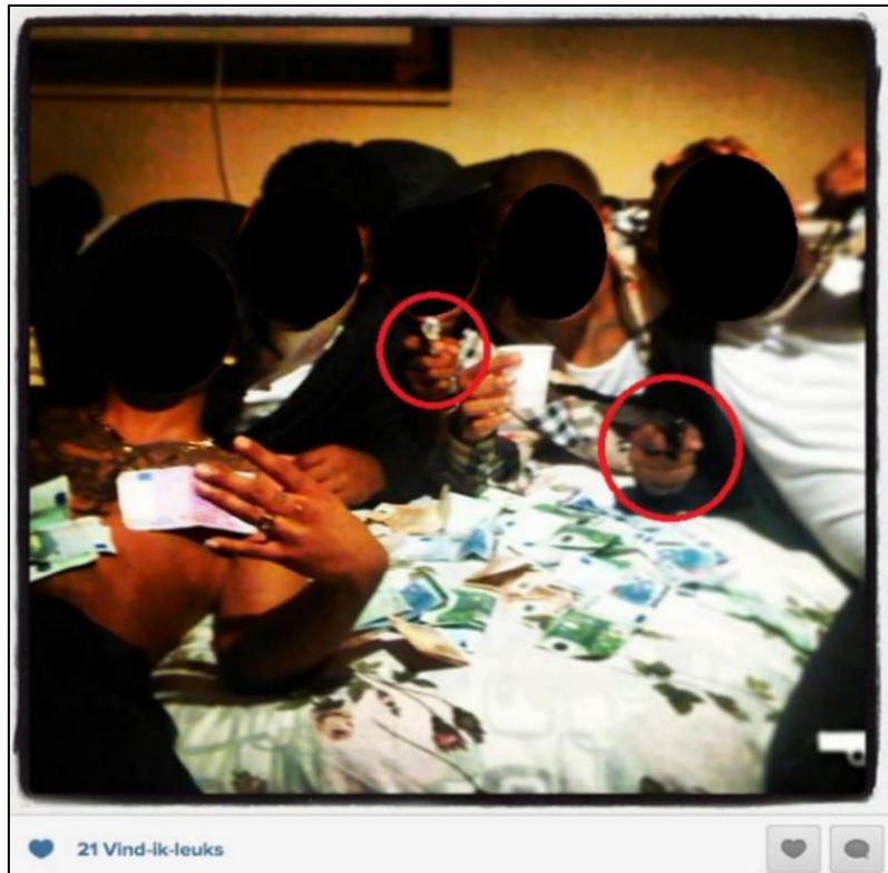
Figuur 5: social mediagebruikers die met statusverhogende elementen poseren

Alle respondenten zijn het erover eens dat binnen de online straatcultuur en Hiphop-scene regelmatig sprake is van gewelddadige communicatie. Om de gespreksstof rondom dit onderwerp aan te wakkeren is aan de respondenten de onderstaande afbeelding getoond. Daarbij is dezelfde situering en vraagstelling gebruikt als bij het eerder getoonde fotomateriaal.