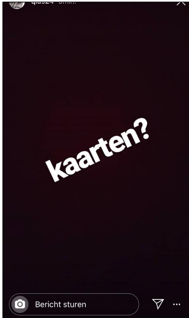
Figuur 8: oproep op social media voor pinpassen

Geen enkele respondent signaleert in figuur 8 de zinspeling op criminaliteit. Binnen de online straatcultuur wordt regelmatig gevraagd om 'kaarten'. 59 Middels straattaal vragen zij aan elkaar om pinpaskaarten (pinpassen), hetgeen verwijst naar pinpasfraude. Als het ware probeert de plaatser van figuur 8 een zogenoemde geldezel te ronselen. Een geldezel 60 is iemand die zijn bankrekening laat dienen als witwasconstructie voor criminelen. Alle respondenten associeerden dit social media bericht met vrijetijdsbesteding hetgeen varieerde van een 'potje kaarten' tot het kopen van 'concertkaarten'.