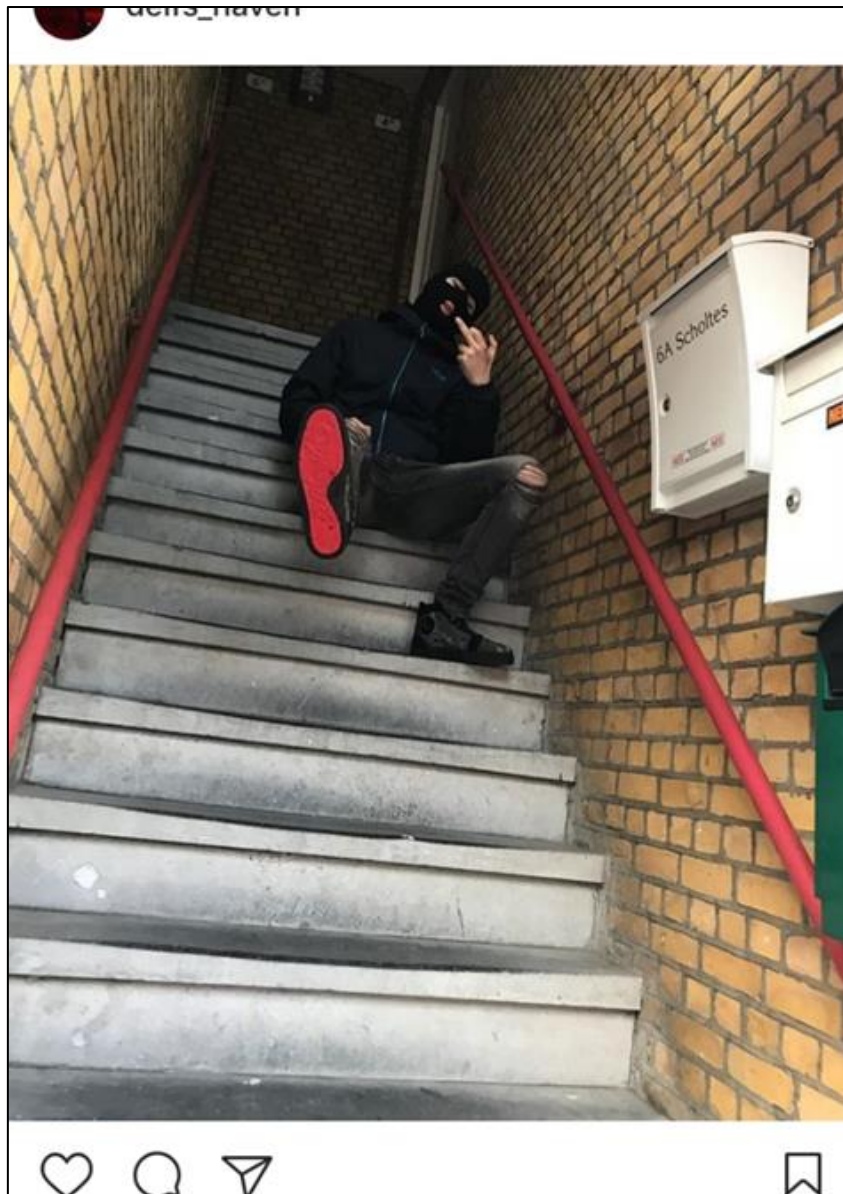
Figuur 6: social mediagebruiker die met kenmerkende symbolen poseert in een portiek

Bij het tonen van figuur 6 associëren alle respondenten de bivakmuts met criminaliteit. Verder koppelen zij de middelvinger aan een pro-criminele houding. Respondenten 4, 5 en 8 noemen ook dat hij hiermee wil zeggen dat hij schijt heeft aan politie en justitie. Respondent 1 benoemt als enige dat deze jongen bewust in de portiek gaat zitten om te laten zien dat hij van een bepaalde buurt komt wijzend op de straatidentiteit die hij online wil benadrukken. Een ander risicosignaal wordt door zes van de elf respondenten gesignaleerd, namelijk het opzichtig consumeren. Het opzichtig consumeren komt tot uiting doordat deze jongen bewust zijn rode zool laat fotograferen. Deze rode zool is kenmerkend voor het zeer exclusieve schoenenmerk 'Louboutin' 58 . Alle respondenten zijn het unaniem over eens dat signalen van opzichtig