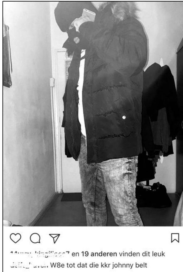
Figuur 9: social mediagebruiker die zich profileert als drugsdealer

De interpretaties van figuur 9 lopen uiteen. Acht respondenten denken dat er vanuit deze foto een bepaalde dreiging uitgaat en dat de persoon iets gewelddadigs tegen een andere persoon wil gaan ondernemen. Drie van de elf respondenten associëren de afbeelding met drugs-criminaliteit. Respondent 1 heeft deze associatie omdat drugsdealers vaak per telefoon te bereiken zijn. Respondenten 4 en 11 slaan beiden aan op de straattaal die onder de afbeelding beschreven staat. Respondent 4 herkent de tekst van een hiphop nummer: