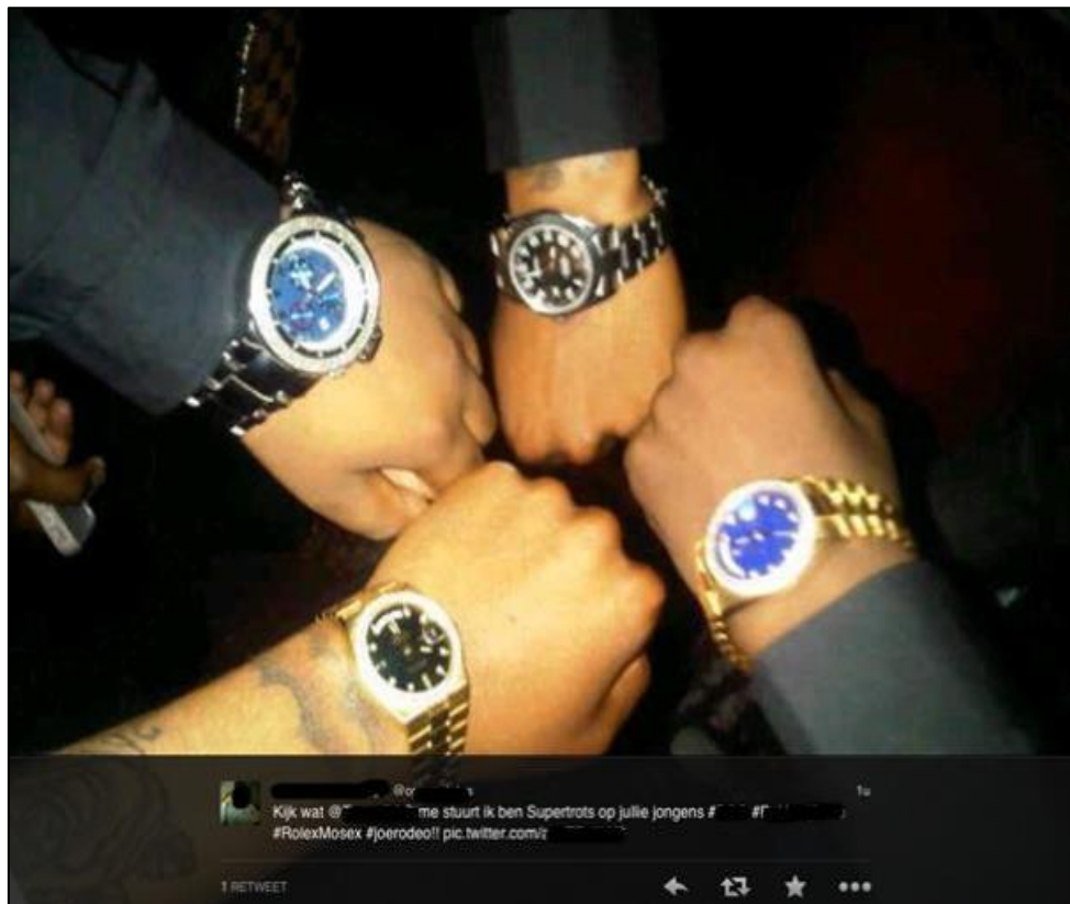
Figuur 4: social mediagebruikers die poseren met luxe horloges

"Het trieste is wel dan zit je hier met je vier flesjes Johnnie Walker. Als enig whisky kenner zou ik zeggen wat is dat voor goedkope troep. Het is nog geeneens kwaliteit. Maar het feit dat ze het kunnen kopen in de club en 'bottles kunnen poppen', 47 daar draait het dus om!" (R4)