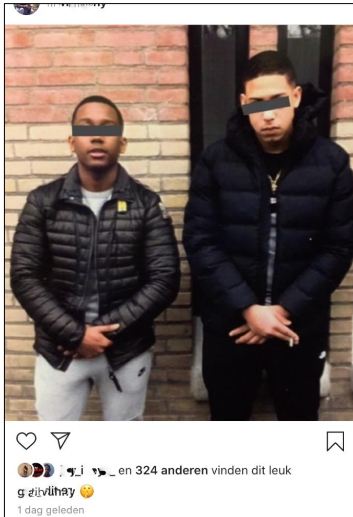
Figuur 7: social mediagebruikers die onherkenbaar poseren

"Hij zegt fuck jullie en hij heeft volgens mij hele dure louboutins schoenen aan. Hij doet gangster, ik kom uit de wijk en zit dus in een portiek. Hij is niet herkenbaar en die bivakmuts staat in feite voor criminaliteit."