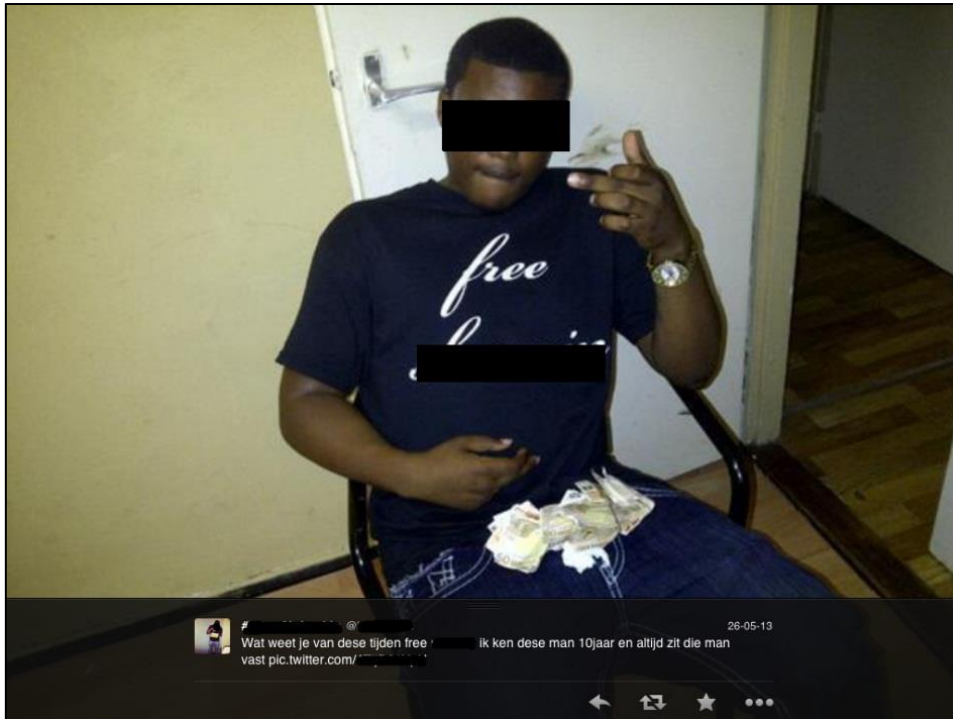
Figuur 2: social mediagebruiker die poseert met verschillende straatculturele symbolen

Wanneer figuur 2 te zien is, zegt een ruime meerderheid dat de zogenoemde 'Free-uitdrukking' kenmerkend gedrag is binnen de online straatcultuur. Acht respondenten geven aan dat de plaatser hiermee zijn vriend uit de gevangenis wenst. Respondenten 8, 9 en 10 vullen daarbij aan dat dit gedrag ook geïnterpreteerd kan worden als een respect- en/of steunbetuiging. De overige respondenten signaleren alleen het geld wat op de foto te zien is.