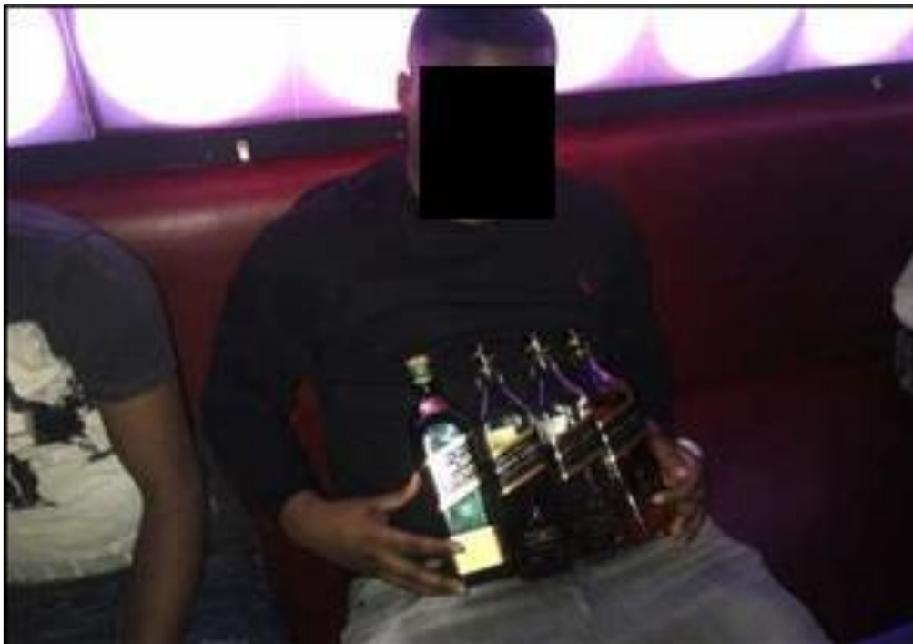
Figuur 3: social mediagebruiker die poseert met flessen drank

De overige vijf respondenten rapporteren dat ze het opzichtig consumeren vooral signaleren tijdens de meldplichtgesprekken. Zij zien cliënten die in het bezit zijn van dure kledingstukken, luxe goederen en/of cash geld hetgeen niet strookt met hun inkomenspatroon. Vier respondenten denken dat het gros van de collega's niet op de hoogte is van designer merken. Zij vermoeden dat veel collega's hierdoor niet de kennis hebben om waardevolle designer kleding of luxe goederen te herkennen en te taxeren. Om dieper in te gaan op dit onderwerp is aan alle respondenten twee afbeeldingen getoond. Daarbij is gebruik gemaakt van dezelfde situering en vraagstelling als bij het eerder getoonde materiaal.